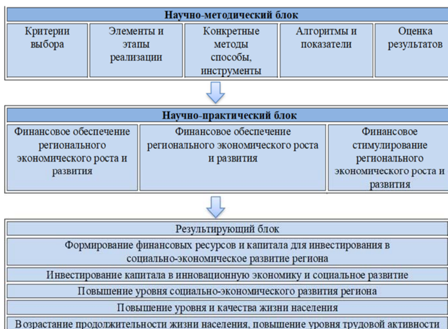
Рис. 1. Научно-теоретические основы применения финансовых методов.