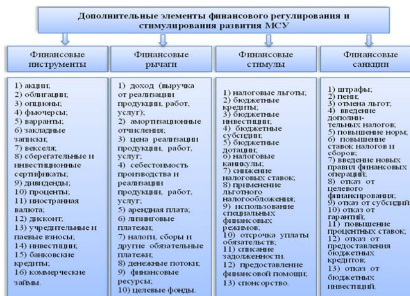
Рис. 3. Дополнительные элементы финансового регулирования и стимулирования развития МСУ.