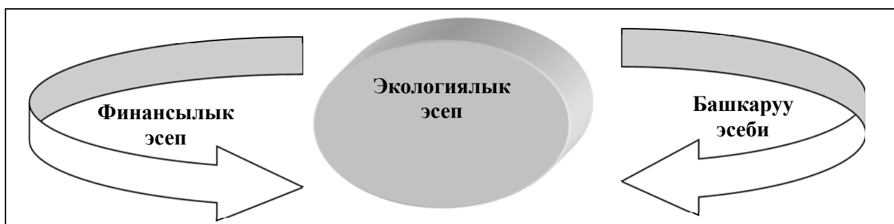
1-сүрөт. Экологиялык эсептин финансылык, башкаруу эсептери менен байланышы.

Экологиялык эсеп ишканада колдонууда финансылык эсептин эрежелерине ылайык жүргүзөт. Ошону менен бирге, бухгалтердик эсепте чагылдырылган чарбалык иш-фактылардын жыйындысы болуп саналат. Бул учурда, экологиялык эсеп финансылык отчеттун бир бөлүгү катары берилгени менен, бирок башкаруу чечимдерин кабыл алууда экологиялык чыгымдар жөнүндөгү маалыматтар туура чечим кабыл алууга зор өбөлгө болот (1-сүрөт).