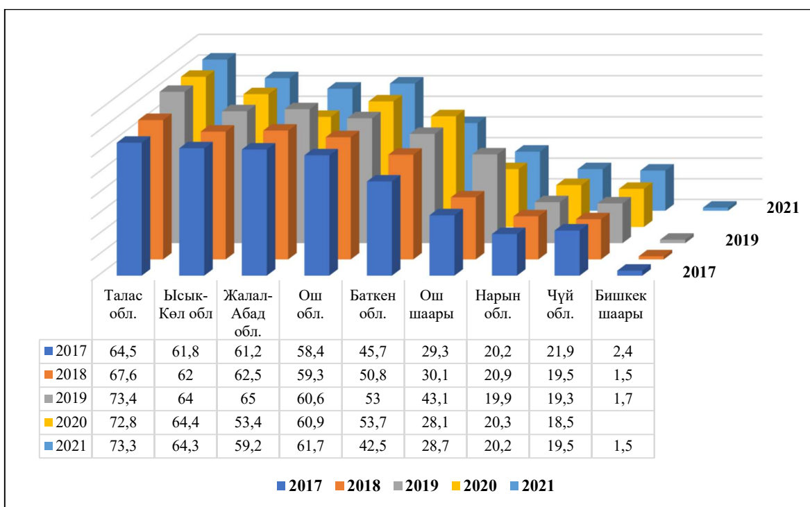
3-сүрөт. 2017-2021-жылдарга мөмө-жемиштердин аймактар боюнча түшүмдүүлүгү (гек/ц.)