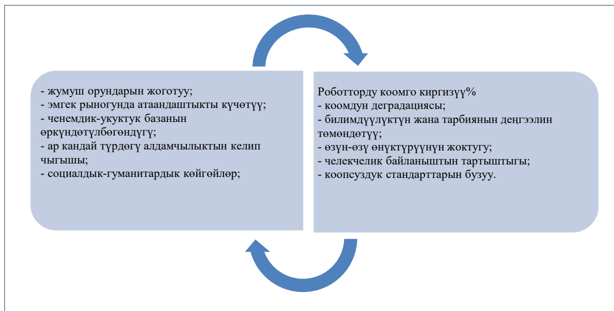
1-сүрөт. Санариптик технологияларды массалык түрдө колдонуунун тобокелдиктери жана коркунучтары.

Экономикалык коопсуздуктун келип чыгуучу коркунучтары экономиканын ар кандай субъекттеринин кызыкчылыктарынын карама-каршылыктарынан келип чыгат, карама-каршылыктар социалдык-экономикалык иштин башка субъекттеринин кызыкчылыктары менен дайыма эле дал келбегендиктин эсебинен түзүлөт. Кандай максаттарды көздөгөнүнө жараша, мамлекет, бизнес, коом же жеке адам болобу, ошол эле жагдайлар (түзүлгөн кырдаалдар) терс же жагымдуу, ошондой эле экономикалык коопсуздуктун факторлору же шарттары катары каралышы мүмкүн. Бул так экономикалык коопсуздук шарттары, башкача айтканда, бир "чыпкасы" катары кызмат менен чектеп, жалпы, тигил же бул себептерден улам пайда болуу коркунучун баалоо үчүн маанилүү болуп саналат.