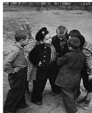
4-сүрөт. 1980-жылга чейинки балдар, оюн учурунда.

технология өнүккөн, ар кыл мүмкүнчүлүктөрдүн пайда болгон мезгилинде чоңоюшкан жана онлайн иштөөнү жактырат, дүйнө кезишет, эки-үч жогорку билими бар. Офисте иштөөнү жактыра беришпейт. Бир жерде көпкө кармалбайт.