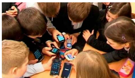
5-сүрөт. XXI кылымдын балдары, оюн учурунда.

Ал эми 2000-жылдардан кийин төрөлгөн зет (Z, зумерлер) мууну дагы көбүрөөк онлайнда, тагыраак айтканда иштеринин дээрлик көпчүлүгүн онлайн бүтүрүшөт. Алардын реалдуу жана интернет дүйнөсү бар.