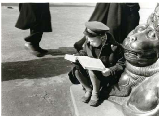
2-сүрөт. 1980-жылга чейинки балдардын билим алуусу.

Азыркы күндө дүйнөдө Уильям Штраус жана Нил Хау аттуу америкалык изилдөөчүлөрдүн «Муундар теориясы» деп аталган эмгеги кеңири жайылып, ага ылайык болжолдуу жыйырма жыл аралыгында төрөлгөндөр дүйнө таанымы, кызыкчылыктары боюнча бир муунга кирет. Ал муундун өкүлдөрүндө өз-дөрүнө таандык өзгөчөлүктөр даана байкалат. Мисалы, 1960-1980 жылдары туулгандар (X мууну) үчүн стабилдүүлүк, дайымкы иштеген иши, телевизор, коллективдүү эмгек маанилүү.