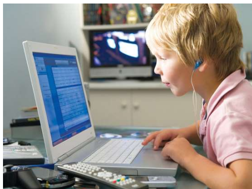
3-сүрөт. Жаңы муундун балдарынын билим алуусу.

1980-2000 жылдарда төрөлгөн муундун (Y мууну, миллениалдар) кызыкчылыктары башка. Алар