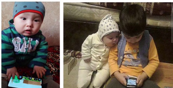
1-сүрөт. XXI кылымдын балдарынын өнүгүүсү.

үчүн XXI кылымдын балдарынын өзгөчөлүктөрүнө көңүл буруп көрөлүчү.