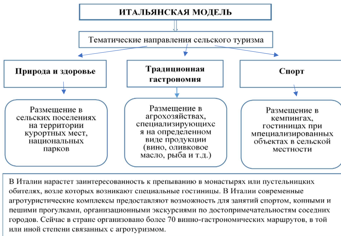
Рис. 3. Итальянская модель.

Несмотря на то, что услуги сельского отдыха в Италии почти в 2 раза дороже, чем в Испании и Франции, ими ежегодно пользуются до 2 млн. чел. (из них 78% - итальянцы). Ежегодная прибыль в сфере агротуризма составляет около 400 млн. долл. США.