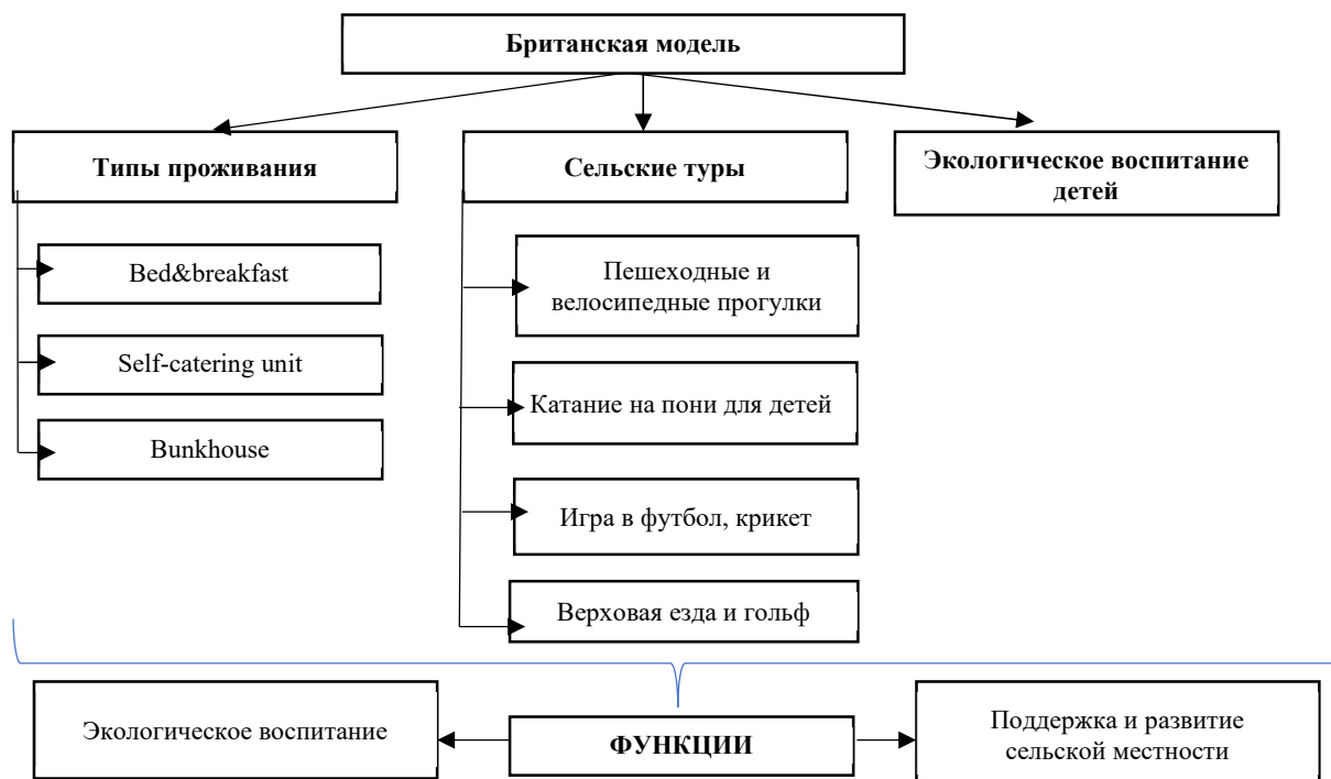
Рис. 2. Британская модель.

является самым экономичным (средняя стоимость ночевки одного человека составляет около 10 евро) и поэтому очень привлекателен для молодежи, прежде всего, для небольших студенческих групп.