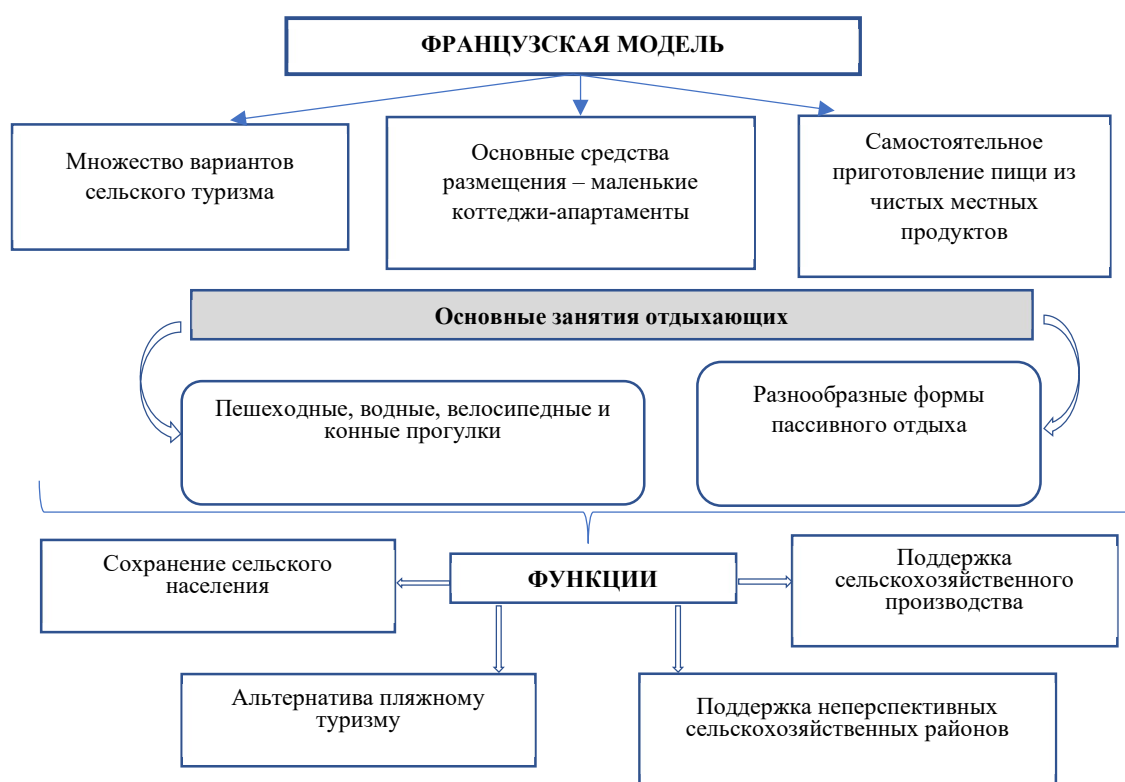
Рис. 1. Французская модель.

Винный туризм является «лицом» французского сельского туризма. За этим названием скрывается множество туристских занятий: дегустация вин и шампанских; посещение нескольких винодельческих хозяйств, производящих одноименные сорта вин; изучение технологического процесса виноделия на любительском и профессиональном уровнях; ознакомление с правилами подачи вина к столу и сочетаемости его с гастрономическими блюдами; коллекционирование марочных вин.