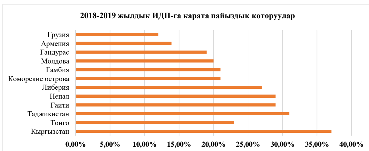
3-сүрөт. Дүйнө өлкөлөрү - акча которуулар боюнча лидерлер, ИДПга карата%, 2018-2019-жж.

Дүйнөлүк Банктын маалыматы боюнча, 2018-2019-жылдары мигранттардан өнүгүп келе жаткан өлкөлөргө акча которуулар 500 миллиард АКШ долларынан ашты.