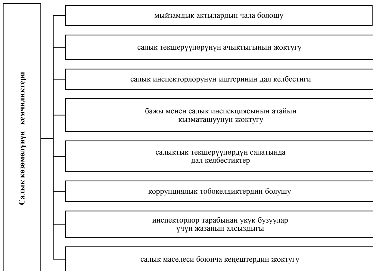
2-сүрөт. Кыргыз Республикасынын салык көзөмөлүнүн кемчиликтери.

Кыргыз Республикасынын салык көзөмөлүнүн кемчиликтери азыркы күндө так жана даана белигилүү болуп турат.