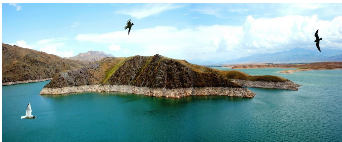
Кызыл-Мойнок аралы (Киров суу сактагычы)

Киров суу сактагычы. Суу сактагыч Талас суусунун нугунда курулган. Негизинен сугатчылыкта пайдаланып, ошол жердин ишканаларын суу менен камсыз кылат. Суу агымын сезон боюнча жөнгө салып турат. Узундугу 14 км, эң жазы жери 3 км, эң терең жери 72 м, суу толгондогу аянты 28,6 км 2 . Сыйымдуулугу 550 млн м 3 . Талас обл-нын 142 миң га жерин, Казахстандын айрым райондорунун 60 миң га жери сугарылат. Плотинасынын уз 258,5 м, эң бийик жери 83,7 м. Гидротехникалык курулушу татаал. Өлкөдөгү контрфорс тибиндеги курулган тунгуч плотина. Бири-бирине тутумдашкан 10 болуктон турат (ар биринин туурасы 22 м). Бул суу сактагыч дагы өзүнүн уникалдуулугу жана кооздогу менен айырмаланат. Суу сактагычтын айылга жакын жеринде атайын сууга түшүүчү пляждагы курулган.