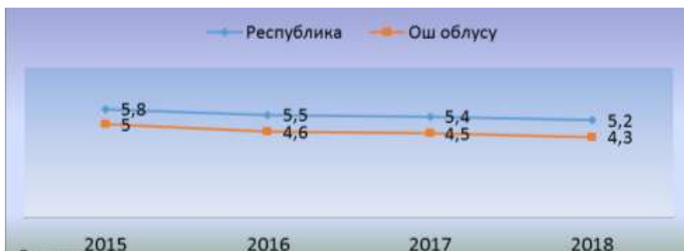
2-сүрөт. 2015-2018-жылдарга өлүм көрсөткүчү (1000 кишиге).

2-диаграммада көрүнүп тургандай Республика жана Ош облусу боюнча өлүм көрсөткүч төмөндөгөн. Салыштырмалуу караганда 2015-жылы облустун көрсөткүчү 0,8 ге, калган жылдары 0,9 га Республиканын көрсөткүчү төмөн болгон.