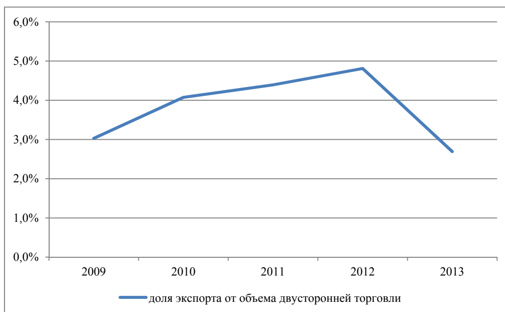
Рис. 2. Динамика доли экспорта Кыргызской Республики от общего объема двусторонней торговли с КНР в период по 2009-2013 гг.

достигает 21,7% из всей завозимой в страну продукции. Доля экспорта Кыргызской Республики от общего объема двусторонней торговли за этот период в среднем составила 3,8% (рис. 2).