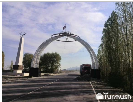
Арка при въезде в Баткенскую область