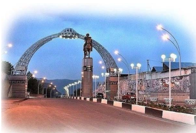
Рис. 2. Комплекс “Кыргыз кочу” (г.Ош).

Один из самых примечательных въездных комплексов Кыргызстана «Аска Таш» находится у северо-западного въезда в город Бишкек, который является воротами столицы (рис. 3). В отделке комплекса применены новые мотивы – саймалуу таш (петроглифы), что дополняют ансамбль стилизованных гор «Аска Таш». Сами петроглифы выполнены из полиэстера и оформлены контурной подсветкой. Элемент в виде стилизованного солнца очищен и окрашен в золотой цвет. Надпись «БИШКЕК» изготовлена и установлена на металлической структуре высотой в 1,5 метра. В ночное время комплекс освещается прожекторами и стробоскопами. Здесь также работают фонтаны, которые ночью подсвечиваются.