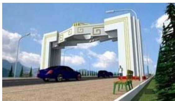
Рис. 9. Эскиз въездных ворот в Алайский район.

Также разрабатывается новый проект въездных ворот Алайский район, где монумент сделан в виде современной интерпретации элементов юрты (рис. 9).