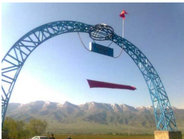
Арка при въезде в село Жаны-Арык Джумгалского района, Нарынской области