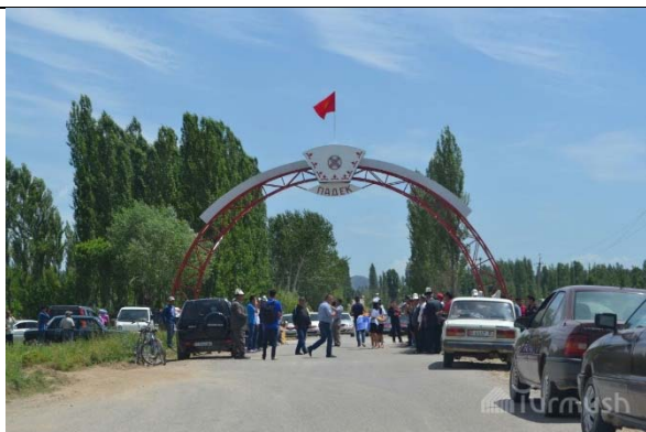
В Ала-Букинском районе выпускники 2006 года построили арку у въезда в родное село