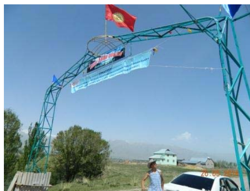
Арка при въезде в село Кош-Добо Иссык-Кульской области