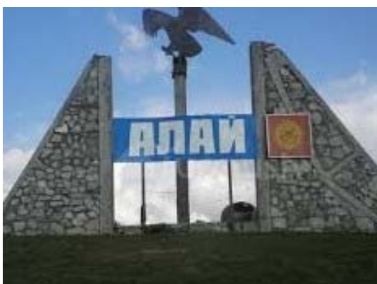
Въездной монумент в Алаский район