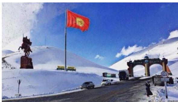
Рис. 6. Въездные ворота в Таласскую область.

Можно также отметить въездные ворота в виде эко-поста в городе Балыкчи, построенного в 2003 году как офис биосферной территории “Иссык-Куль” (рис. 7). Сейчас здесь создан музей. Целью создания музея является повышение осведомленности жителей Кыргызстана об уникальной природе Иссык-Кульской области и мерах ее сохранения. Музей располагается на 2-х этажах в 4-х больших залах.