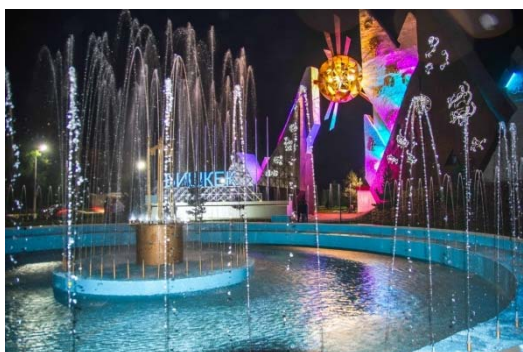
Рис. 3. Комплекс “Аска-Таш” (г.Бишкек).

Ворота города Джалал-Абад – монументальный комплекс «Курманбек - наследие веков» расположен у въезда в город на территории села Ырыс Сузакского района (рис. 4). Монумент, состоявший из арки и памятника народного героя Курманбека, был построен в 2001 году в честь празднования 500-летия героя Курманбека. Сейчас комплекс является одним из достопримечательностей города, куда приезжают свадебные кортежи, горожане и гости Жалал-Абада, чтобы поклониться памяти народному герою Курманбеку.