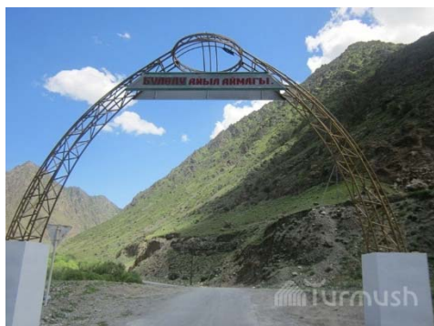
Арка в селе Булолу Алайского района Ошской области