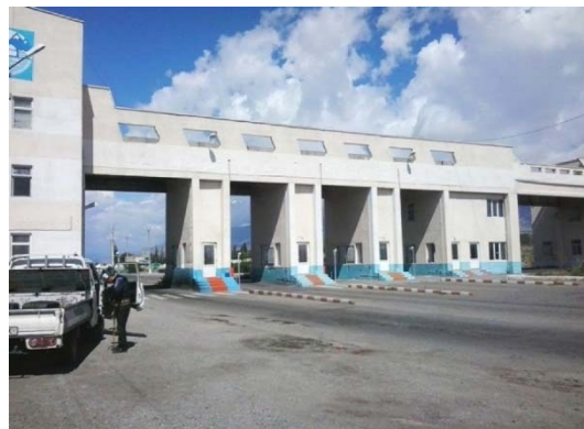
Рис. 7. Эко-пост во въезде в Балыкчи.