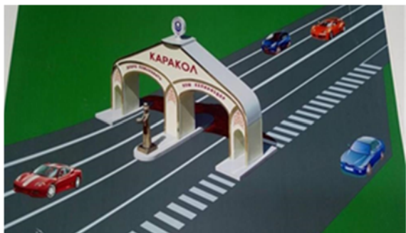
Рис. 8. Эскиз ворот в Караколе.

будут переделаны. Проект называется «Ысык-Кол ааламдын кареги - Азия борбору» (“Кыргызстан – центр Азии, а Исык-Куль его око”). Монумент несет собой исторически философское значение, внизу есть половина глобуса, наверху – око глаза, чуть ниже волны озера нашего, горы наши и на самом веру звезда «Чолпон», которая обозначает новую жизнь. Планируется, что работы будут выполнены к 2018 году или же к 150-летию нашего города, празднование которого должно пройдет в 2019 году. Что касается южных ворот Каракола, то здесь комиссия одобрила еще один эскиз проекта. Здесь въезд в виде кыргызской национальной юрты, проект называется «Золотые ворота Каракола» (рис. 8), в соответствии со своим названием, края ворот окрашены в золотой цвет, сверху установлена эмблема Каракола. Согласно обычаю и традициям кыргызов, на входе в юрту гостей встречает кыргызская девушка с хлебом, поэтому тут тоже есть эта идея. Вторая сторона этих ворот пуста, поэтому автору было предложено доработать свой проект и внести некоторые изменения.