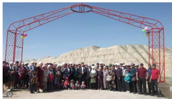
Арка при въезде в село Кайынды-Булак Ак-Талинского района Нарынской области