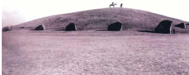
Рис. 2 Большой Салбский курган фото 1910 г.

Об этом свидетельствуют сохранившиеся до наших дней сотни надписей, вырезанных на скалах, возвышающихся на берегах Енисея (рис. 2).