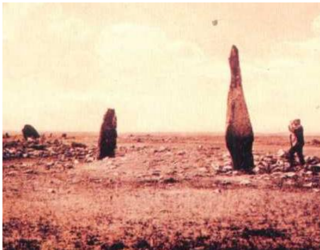
Рис.1. Минусинская долина на Енисее - «Стелы»

Процесс развития кыргызских племен на Енисее под предводительством великого Барсбека, привело в более позднее время, к созданию собственного государства, сложению специфических черт культуры, в частности, к появлению енисейской рунической письменности на древне тюркском языке (рис. 1).