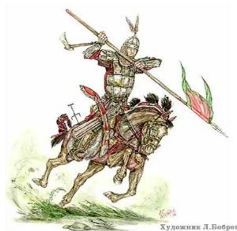
Рис. 3 Кыргызский воин.

Важно констатировать, что узоры также были носителями философско-значимых символов мироздания и служили незаменимым способом графического благопожелания окружающему миру – бесконечности, радости, великодушия, материнства и гармонии. Через узоры на предметах быта или приданного невесты мать могла закодировать благопожелания на будущую семейную жизнь, а специальный узор на одежде больного мог быть пожеланием к выздоровлению.