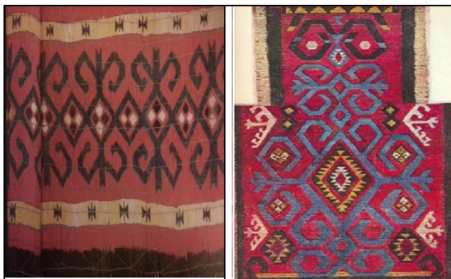
Рис. 4 Хакасский орнамент Кыргызский орнамент «Чий»

Весомое достижение сделанное учеными археологами в изучении кыргызской культуры на территории Минусинской долины и Тывы в 1950 – 60 годы искажены Л.Р. Кызласовым попыткой приписать историю и культуру древней цивилизации кыргызов мифическим этнонимом «ХАКАСС» выдвинутой, как «ХЯГЯС», что в древних китайских летописях означает кыргыз.