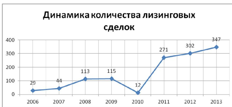
Рис. 2.3. Динамика количества лизинговых сделок

Согласно отчету Союза Банков КР, основным имуществом, переданным в лизинг за последние 4 года является сельскохозяйственная техника. Лизинговые операции по остальным видам техники и оборудования не проводились. Данный факт объясняется тем, что налоговые льготы по лизингу предоставлялись только для лизинга сельскохозяйственной техники. Средний срок лизинга по сделкам заключенным в 2013 году составил 6 лет. Средняя стоимость переданного в 2013 год в лизинг имущества составила 20,4 тыс. долларов США, минимальная стоимость составила 700 долларов США и максимальная 201 тыс. долларов США.