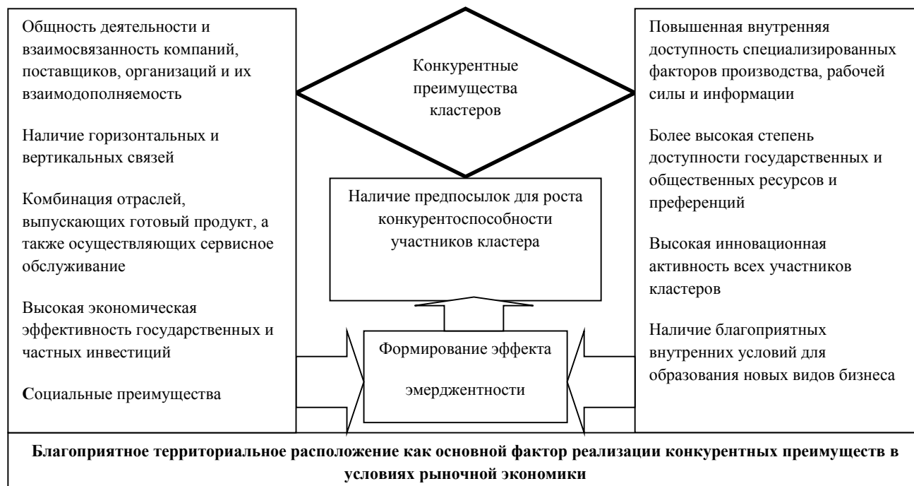
Рисунок 3. Реализация конкурентных преимуществ кластеров в кооперированном и интегрированном поле аграрной экономики

Для этого в составе агрокластера формируются крупные и относительно самостоятельные составные части – отраслевые кластеры. Проведенные исследования позволили определить, что кластерная форма, предусматривающая взаимодействие предприятий, входящих в основную технологическую цепочку создания добавленной стоимости, где присутствуют общие экономические интересы, играет определяющую роль в повышении конкурентоспособности региона.