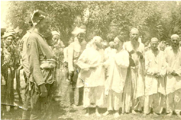
Публичные казни главарей басмаческого движения.