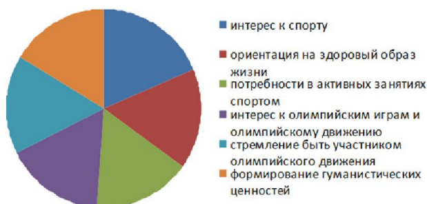
Рис. 2 Направления педагогической деятельности в рамках олимпийского движения.

Важная задача педагогической деятельности в рамках олимпийского движения состоит также в формировании и совершенствовании у молодежи целого комплекса гуманистически ориентированных умений, навыков, способностей: