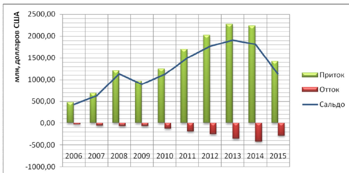
График 2 - Динамика объемов чистого притока ремиттанса в сомах 2006-2015 гг. (11 мес.)