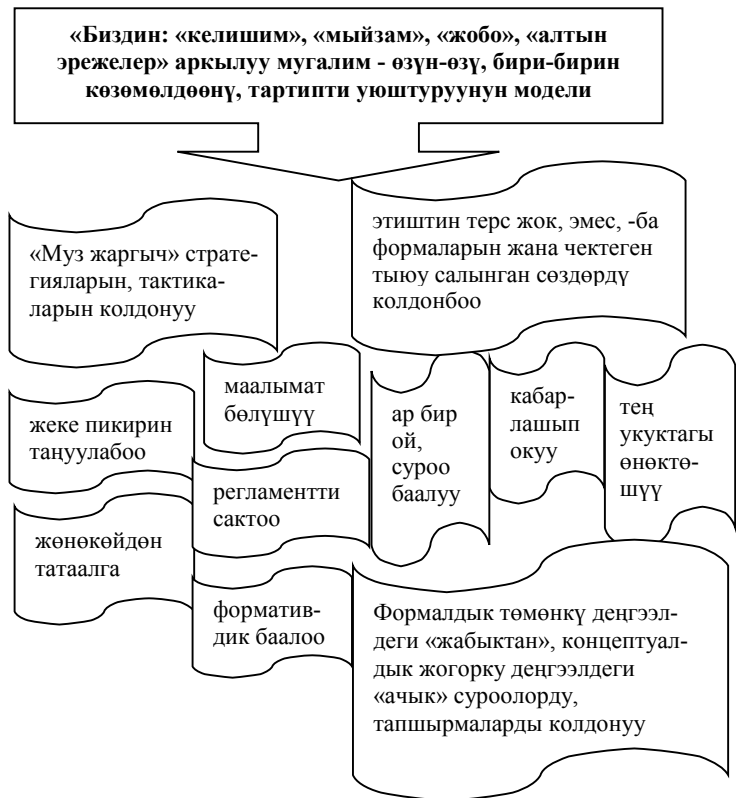
2-сүрөт. Психологиялык-педагогикалык оң жагдайды түзүүнүн модели

Ошентип, аныктоочу, калыптандыруучу эксперименттин жыйынтыгында кыргыз тилин (2) функционалдык-коммуникативдик компетенттүүлүктүн негизинде окутуунун натыйжасында социалдык жана максаттуу дүйнө таанып-билүү компетенттүүлүгүн калыптандыруудагы "психологиялык-педагогикалык оң жагдайды түзүүнүн модели" (2-сүрөт) иштелип чыгып, тажрыйбада тастыкталып, мугалимдерге сунушталды.