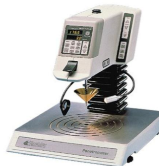
Рис. 2 Пенетрометр марки K95500 Digital Penetrometer

После замачивания образцы варились при комнатных условиях при температуре 90 – 92 °С. Каждые 10 минут определялось единица пенетрации зерен фасоли (рис. 2). Фасоль варили при таких условиях до 55-60 минут. Таким образом, полученные данные единицы пенетрации были использованы для определения оптимального времени варки. Продолжительность варки более 60 минут приводит к разрушению тканевой оболочки зерен фасоли, а также полной деформации зерна в целом. Таким образом, полученные данные (табл. 1) могут использоваться при варке данных сортов фасоли, с условием сохранения пищевой ценности продуктов при гидротермической обработке, что является одним из основных задач при приготовлении пищи. Во вторых, полученные данные дают возможность сохранить привлекательный внешний товарный вид для продукта, что тоже не мало важно. В третьих, экономия электро энергии что напрямую влияет на ценовую политику. Делая продукты питания более доступным для потребителей. Для определения единицы пенетрации применялся пенетрометр Отделение Пищевой Инженерии Кыргызско-Турецкого Университета «Манас», марки K95500 Digital Penetrometer (рис. 2) автоматически читаемым дисплеем. Точность данного прибора составляет \pm 0,05 мм. При определении единицы пенетрации можно также использовать весы массой 50, 100 гр.