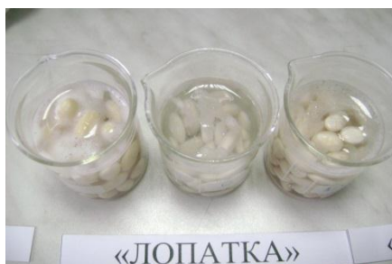
Во время замачивания