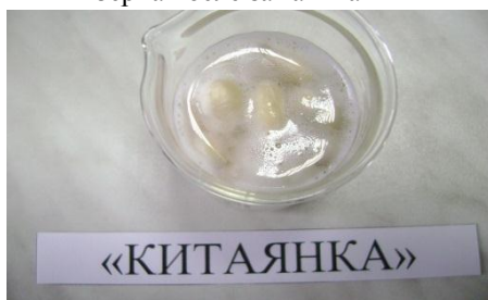
Во время замачивания