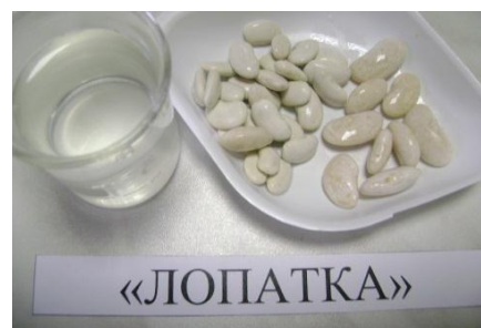
Зерна после замачивания