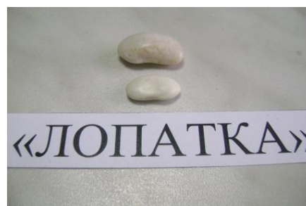
Набухание зерен фасоли

Замачивание можно считать законченным, когда масса бобовых увеличится вдвое. Для определения количества поглощаемой воды во время замачивания были проведены три опыта с каждым из образцов рис. 1. Весь процесс замачивания зерен фасоли проводили при комнатной температуре (около 20-25 °С) [2].