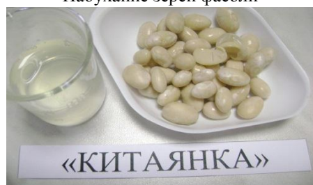
Зерна после замачивания