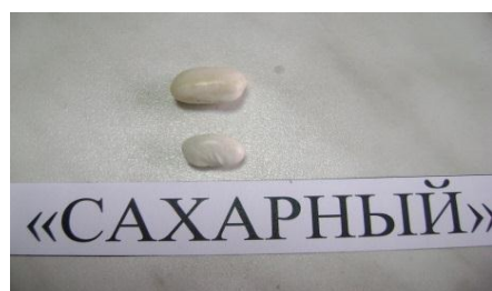
Набухание зерен фасоли