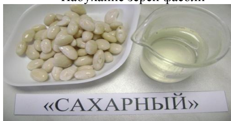
Зерна после замачивания