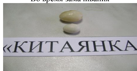
Набухание зерен фасоли