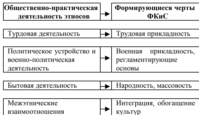
Рис. 1. Общественно-практическая деятельность как исторический фактор формирования национальной ФКиС

Актуализация этнических аспектов ФКиС, определяется ее сущностью и непреходящим значением, которая исторически выработана в процессе эволюции человеческой цивилизации [3]. Главным фактором, которого являются исторически сформировавшиеся виды общественно-практической деятельности этносов [рис. 1]. Безусловно на формирование НФКиС также оказали влияние образ жизни, климатические и географические особенности проживания этноса [1]. В более ранних работах автора [см. 3] национальная физическая культура, определяется как совокупность средств, методов и других условий физического совершенства людей, имеющих выраженную самобытность, которая исторически определена особенностями общественно-практической деятельности этноса.