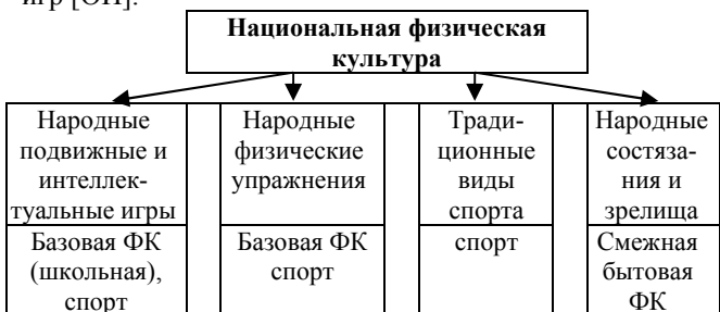
Рис. 2. Содержание национальной физической культуры и современные формы физической культуры и спорта.

Анализ уставов 11 федераций по НВС, показал, что они намерены решать указанную проблему через включение вида спорта в программу олимпийских игр [ОИ].