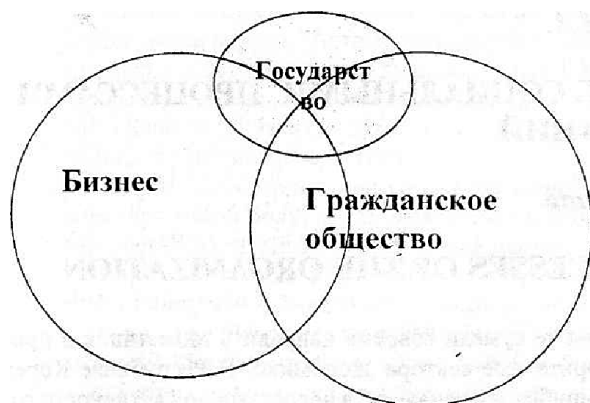
Рис. 2. Желаемая схема взаимодействия всех секторов общества. Примечание - составлено автором

Опыт зарубежных стран показывает, что количество функций, выполняемое государством должны приводить к изменению распределения полномочий между различными уровнями системы государственного управления путем децентрализации (или в некоторых случаях - централизации), а также отказа государства от части функций государственного регулирования и передачи их в другие сектора общества. На рисунке 2 приводится желаемая модель взаимодействия всех секторов общества