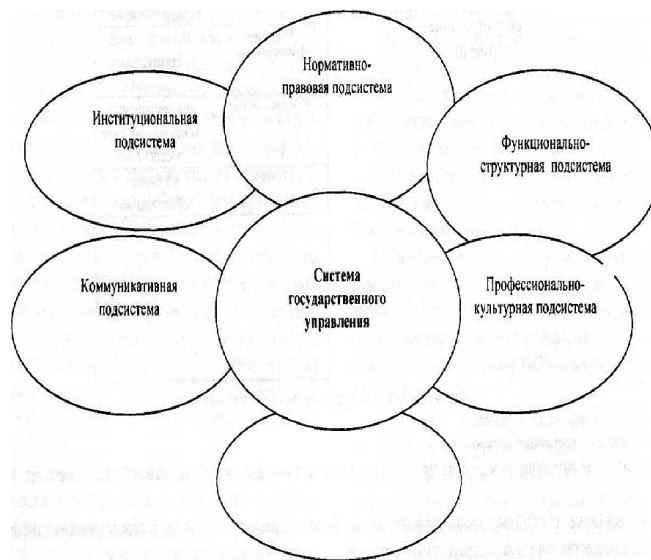
Рис. 3. Структура системы государственного управления

Как отмечает д.э.н Каиржан М.З. государственное управление - это Структура, как известно, это внутреннее строение системы, форма ее организации, совокупность наиболее существенных, системообразующих подсистем, элементов, устойчивые связи между которыми обеспечивают основные свойства системы, ее целостность. Можно выделить шесть системообразующих подсистем государственного управления (рисунок 3)