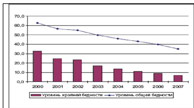
Рис.1. Динамика показателей бедности

Уровень бедности. Как показал анализ статистических данных, уровень бедности по стране имеет тенденцию к сокращению, причем уровень крайней бедности сокращается быстрее (рис.1). Такая динамика свидетельствует о том, что принятые в стране меры позволяют людям выйти из крайней нужды и перейти черту крайней бедности. В то же время преодолеть границу общего уровня бедности гораздо сложнее, и для этого требуется больше времени и усилий. Это подтверждается не только статистически, но и результатами выборочных исследований [2,3,4].