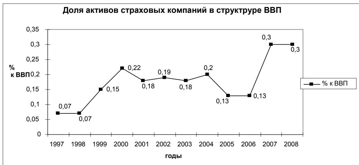
Рис.1 Доля активов страховых компаний в структуре ВВП

Совокупные активы страховых организаций в КР за 12 месяцев 2008 года составили 547,6 млн сомов, по сравнению с аналогичным периодом 2007 года произошло увеличение на 36,9%.