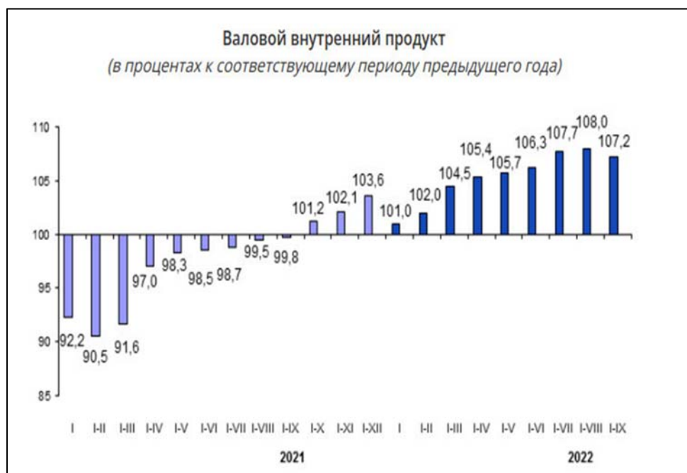
Рис. 2. Валовой внутренний продукт.

Объем производства в горнодобывающей промышленности и разработке карьеров в ЕАЭС увеличился на 1,7%, в электроснабжении, подаче газа, пара и воздушном кондиционировании – на 0,2%, снизился – в обрабатывающей промышленности – на 0,5%, в водоснабжении, канализационной системе, контроле над сбором и распределением отходов – на 5,2%.