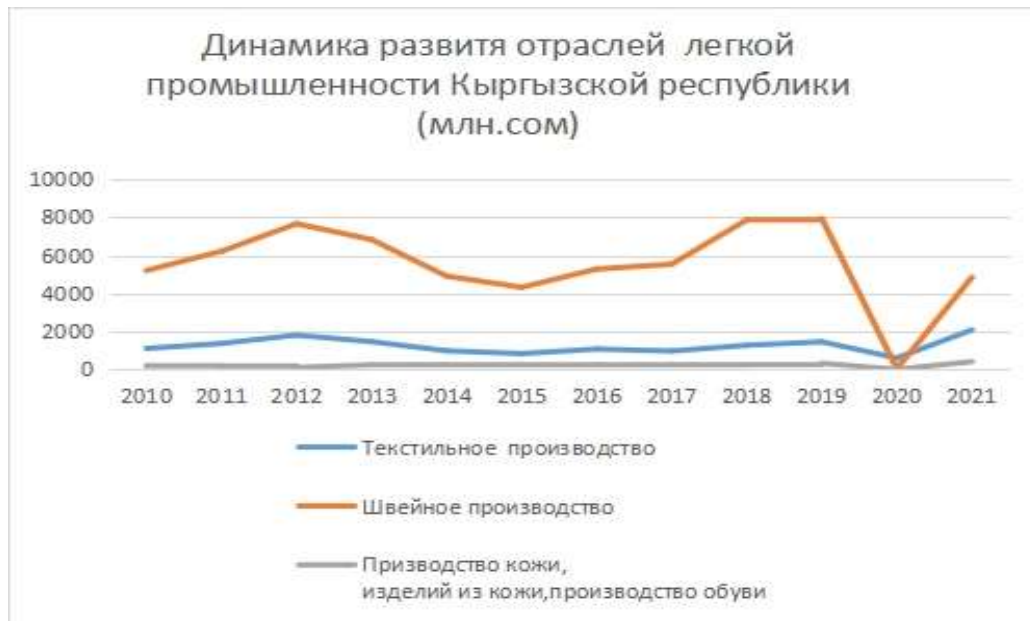
Рис. 1. Динамика развития отраслей легкой промышленности Кыргызской Республики (млн. сом).

Примечание: диаграмма составлена автором на основе данных НСК за 2010-2021 гг.