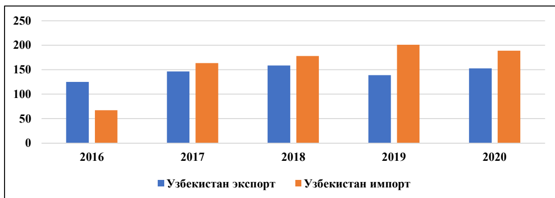
Рис. 2. Экспорт и импорт Кыргызстана и Узбекистана в 2016-2020 гг. (млн. долл. США) [3].

Импорт из Узбекистана представлен следующими видами товаров: фрукты и орехи, свежие или сушеные - 11,4%; предметы одежды и одежные принадлежности - 7,5%; трикотажные или вязаные ткани 7,4%; овощи, свежие или замороженные - 6,6% и др.