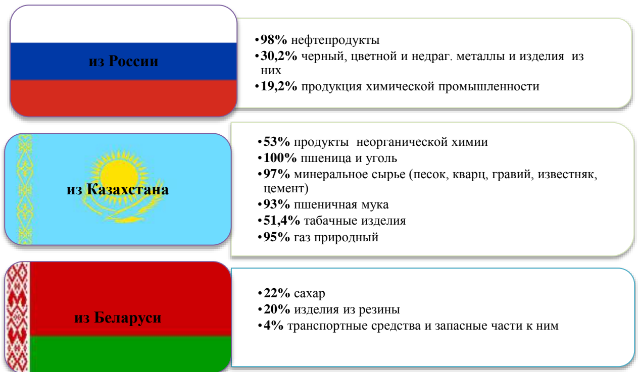
Рис. 3. Основные товарные позиции импорта Кыргызской Республики из стран ЕАЭС.

небольшой внутренний рынок. По результатам рейтингов международной конкурентоспособности и качества предпринимательской среды за последние годы свидетельствуют об общем ухудшении позиций Кыргызстана, основной причиной которого является низкая производительность труда, высокие административные барьеры и уровень коррупции, политическая и экономическая нестабильность, недостаточно развитый финансовый рынок и ряд других факторов.