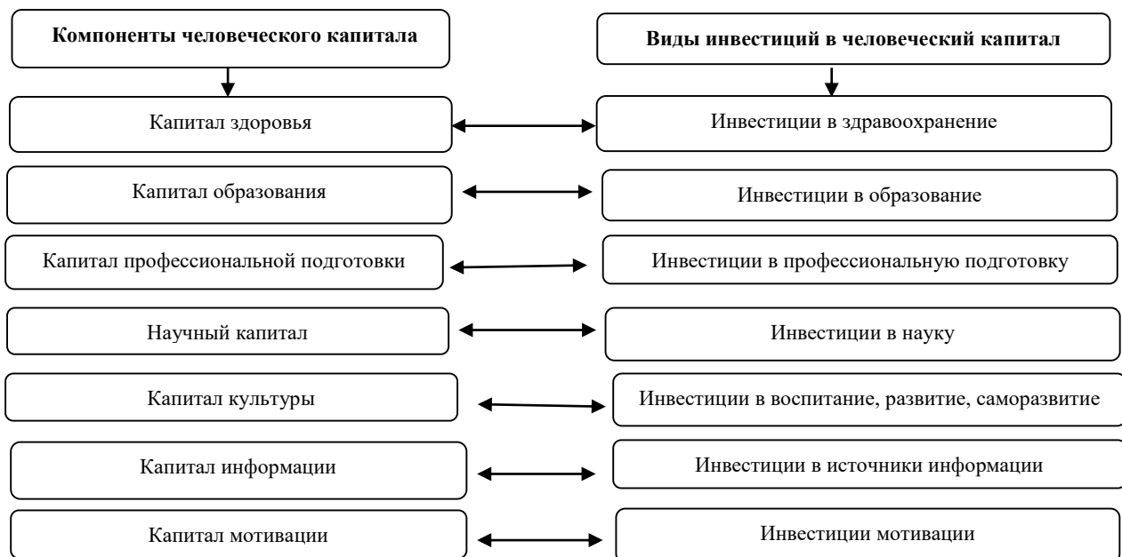
2-сүрөт. Адамдык капиталдын курамдык бөлүктөрү менен инвестициянын байланышы.

Билим берүү социалдык-экономикалык прогресстин фактору катары мамлекеттик саясаттын приоритеттүү тармактарына кирет. Билимдүүлүктүн денгээлинен эмгек ресурстарынын сапаты түздөн түз көз каранды болсо, өз убагында эмгек ресурстарынан экономиканын, өнөр жай, өндүрүштүн абалы көз каранды болот. Билим коомдун социалдык-кесипчилик тармагын кайра өндүрүүнүн фактору катары кызмат кылат. Билим берүү системасы жаранды калыптандырат, ошону менен кошо коомдук турмуштун саясий чөйрөсүнө да таасирин тийгизет. Билим берүүнүн маданий-тарбиялык функциясы, коомдун духовный (акыл-ой) турмушуна да өз таасирин тийгизет. Кандай кесипчилик жактан даярдоо болбосун жалпы маданиятты калыптандырууга салымын кошот, ошол эле мезгилде жеке адамдын жана социалдык группанын социалдык жактан калыптанышына шарт түзөт, коомдогу маданий жетишкендиктерди сактоо менен муундан муунга өткөрүп берет.