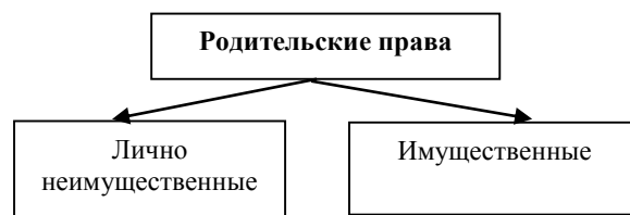
Рис. 1. Виды родительских прав.

ст. 66. («Равенство прав и обязанностей родителей»), ст. 67 («Права несовершеннолетних родителей»), ст. 68 («Права и обязанности родителей (лиц, их заменяющих) по отношению к детям»), ст. 69 («Права и обязанности родителей (лиц, их заменяющих) по защите прав и интересов детей»), ст. 70 («Осуществление родительских прав»), ст. 71 («Осуществление родительских прав родителем, проживающим отдельно от ребенка»), ст. 72 («Право на общение с ребенком бабушки, бабушки, братьев, сестер и других родственников») Семейного кодекса КР [2]. Поэтому понятие «родительские права» является более широким, чем понятие «право на воспитание» и включает последнее в свой состав (рис. 1).