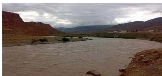
Сыр дарыянын оң курамы.