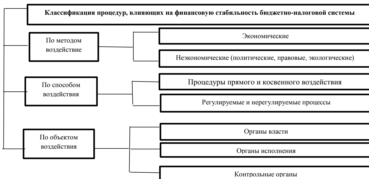
Рис. 1. Классификация процедур, влияющих на финансовую стабильность бюджетно-налоговой системы.