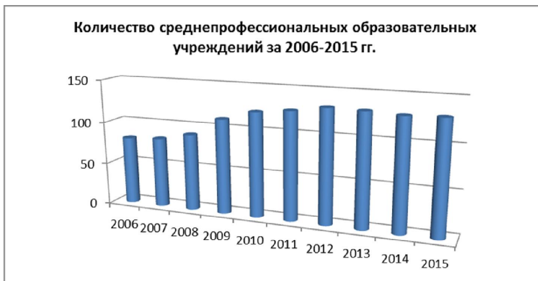
Рис. 1. Динамика изменения количества среднепрофессиональных образовательных учреждений за 2006-2015 гг. 1

На современном этапе, весьма актуальным является повышение экономической эффективности деятельности среднепрофессиональных учебных заведений. Ввиду того, что в Кыргызской Республике наблюдается оживление экономики, практически во всех отраслях повышается потребность в специалистах среднего звена. Именно на этом уровне могут быть трудоустроены выпускники среднепрофессиональных учебных заведений. Однако повышение конкуренции в системе среднепрофессионального образования в последнее время, связанное с ростом данных учебных заведений (см. рис. 1), требует поиска путей повышения конкурентоспособности.