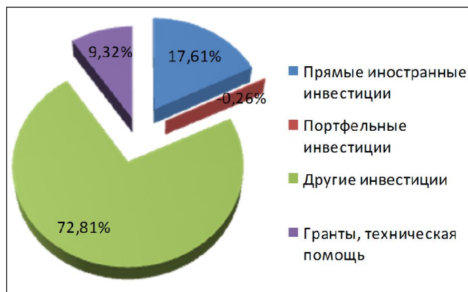
График 1. Динамика поступлений инвестиций за 2015 год в Кыргызскую Республику (Тыс. долл США)

Инвестиции являются источником ускорения экономического роста и улучшения уровня жизни населения. Они, как известно, имеют самые различные назначения, в частности, создание материальных ценностей. Это, например инвестиции в основные фонды предприятий - здания, сооружения и оборудование, необходимые предприятиям для осуществления своей производственной деятельности. Инвестиции в жилищное строительство включают в себя расходы на приобретение домов, как для проживания в них, так и для последующей сдачи в аренду. Инвестиции в запасы включают в себя товары, которые откладываются фирмами на хранение, включая сырье и материалы, а также незавершенное производство и готовые изделия.