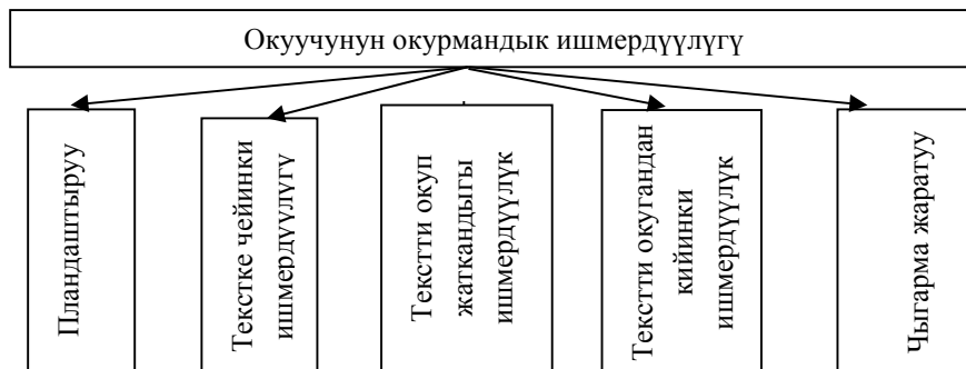
2-сүрөт. Адабий окуудагы окуучунун окурмандык ишмердүүлүгү.

Адабий чыгармаларды окутуу жогоруда көрсөтүлгөндөй, окурмандык ишмердүүлүк аркылуу 4 багыт боюнча жүргүзүлөт: пландаштыруу, аткаруу, көзөмөлдөө, баалоо. Аткаруучулук ыкта тексттин объектисин тактоо, сөздүк жумуштарын аныктоо, анын ички кепте кабыл алуусуна көмөк көрсөтүү, көзөмөлдөөчү ыкта тексттин мазмунунун максатын тактоо, мазмунун бөлүктөргө бөлүп, план түзүүгө даярдоо, ал эми баалоо системасы окуу процессинде метод катары кабыл алынат. Демек, адабий окууда окуучунун ишмердүүлүгү төмөнкү багыттар боюнча каралат (2-сүрөт).