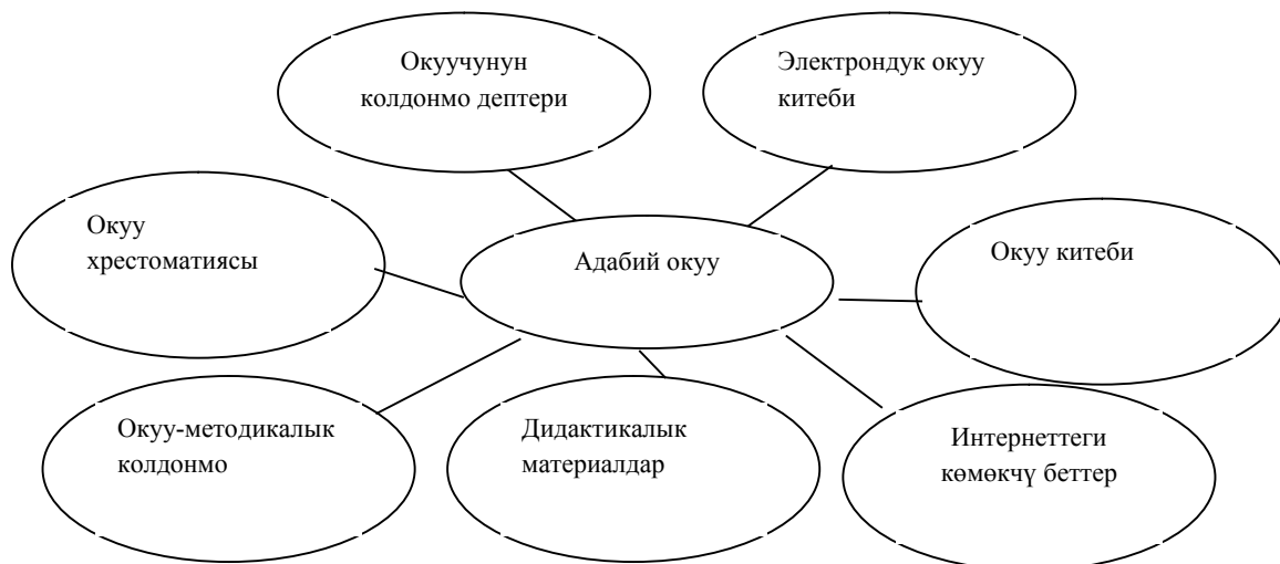
3-сүрөт. Адабий окуунун компоненттери

Адабий окууга үйрөтүүдө тексттин мазмунун ачууда окуу китебинин мазмунунун негизги компоненттери башкы ролду ойнойт. Демек, компоненттерди аныктоодо окуу китебинин мазмунунун компоненттери аныкталат (3- 4-сүрөт)