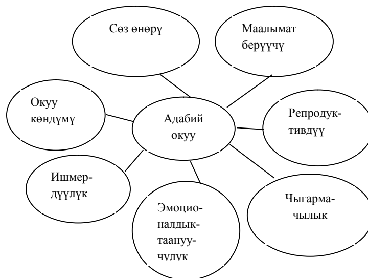
4-сүрөт. Адабий окуунун мазмунунун негизги компоненттери .