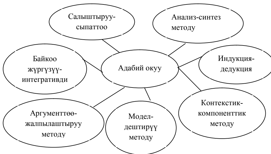
1-сүрөт. Адабий окууга үйрөтүүдө колдонуучу методдор.

Адабий окууда элдик оозеки чыгармаларды окутууда кеп – бул тилдик баарлашуунун иш-аракетин көзөмөлдөйт. Биз маалыматты кабыл алуу үчүн угабыз жана окуйбуз, ал эми маалыматты жөнөтүү үчүн сүйлөйбүз жана жазабыз. Ушуга байланыштуу кеп ишмердүүлүгүнүн 4 түрүн бөлүп көрсөтүүгө болот: угуу жана окуу, сүйлөө жана жазуу. Демек, адабий окуу угуу жана сүйлөөдө текстти окуу, ал эми текстти талдоодо сүйлөө функциясын камсыз кылат. Сүйлөө жана жазууда көбүнчө жазуу жумуштары каралары талашсыз. Мында көбүнчө чыгармага чыгарма жаратуу, эссе жазуу, дил баян, мазмундаманы жүргүзүү сунуш кылынат. Пикирлешүүнүн түрлөрү оозеки жана жазууда дифференциаланат. Ушул функциясы боюнча адабий окуу пикирлешүүнүн жазуу түрүнө кирүү менен жазууну, сүйлөөнү, угууну пикирлешүүнүн оозеки формасын реализациялайт. Бул жумуштарды жүргүзүү окутуу процессинде методдорду тандоого маанилүү. Адабий окууда төмөнкү методдорду сунуштоо ылайыктуу (1-сүрөт).