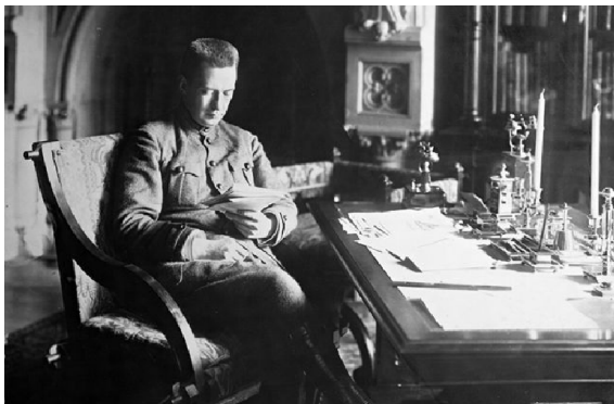
А.Ф. Керенский Убактылуу Өкмөттүн башчысы. 1917-ж.

Ошентип, биз Керенскийди 1917-жылдын 25-26-февралынан баштап 7 ноябрга чейин Убактылуу Өкмөттүн курамындагы министр, 20-июлдан баштап Бүткүл Россиялык Убактылуу Өкмөттүн төрагасы-министри же азыркы тил менен айтканда Убактылуу Өкмөттүн премьер-министри катары көрөбүз.