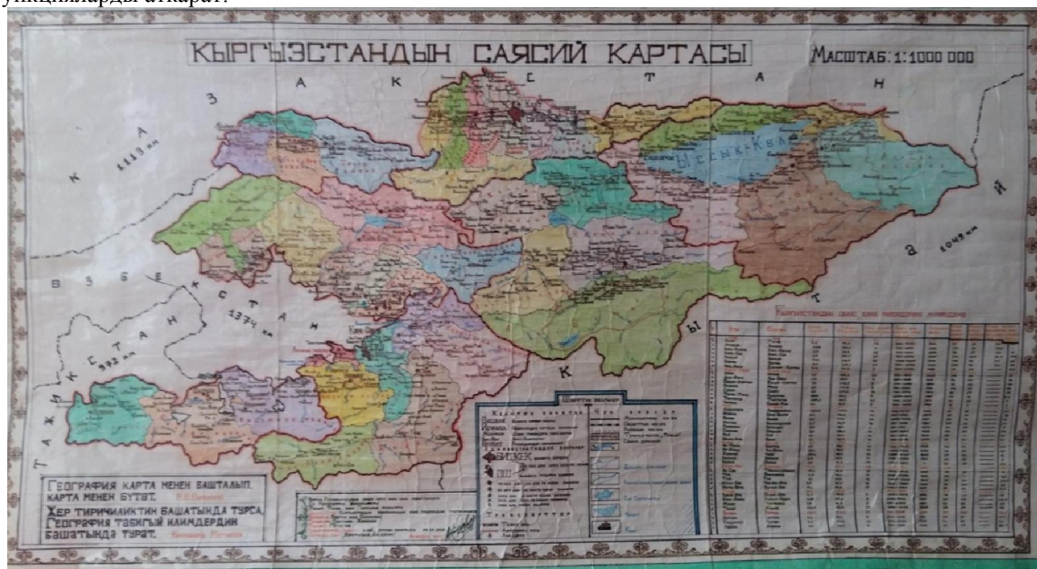
3-сүрөт. Кыргызстандын саясий картасы

Карта шарттуу белгилердин тили менен анда сүрөттөлгөн предметтердин жайгашышын, алардын мүнөздөмөсүн жана абалынын өнүгүүсүн жана өзгөрүүсүн чагылдырат. Буга чейин колдонуу үчүн чыгарылган карталар башка тилде болгондуктан мектепте жана жогорку окуу жайларда колдонуу үчүн мамлекеттик тилдеги карталарды даярдоо мезгил талабы. Биз билген карталардагы географиялык аталыштардын, жазуулардын, шарттуу белгилердин баары орусча болгондуктан менин жетекчилигимин астында түзүлгөн төмөндөгү мамлекеттик тилдеги карталарды колдонууну сунуш кылабыз (3-4-сүрөт).