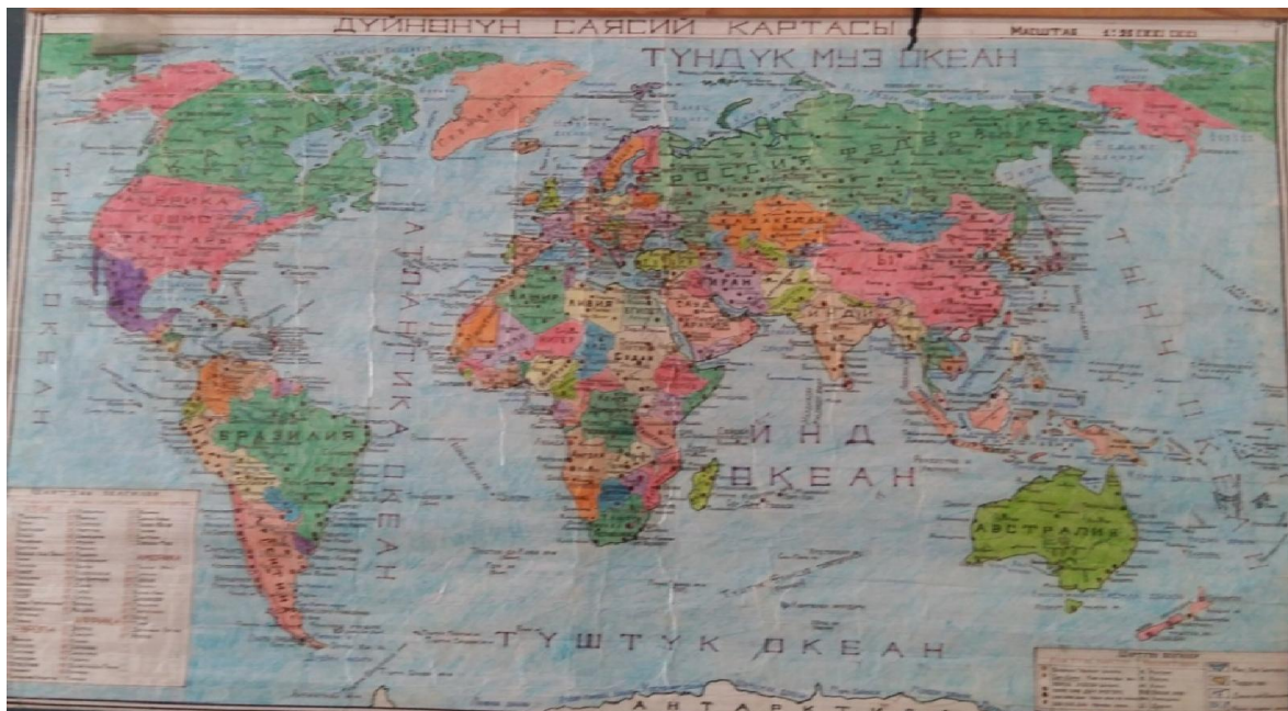
4-сүрөт. Дүйнөнүн саясий картасы

Көрсөтмө куралдар - таблицалар, плакаттар, сүрөттөр, табыгый объектилер. Алар көбүнчө кол менен жасалат жана окутуучунун тажрыйбасы окутуп изденүүсү аркылуу ишке ашырылат. Булар таркатылып берилүүчү материалдар болот, анын ичинде темага ылайыкташтырылган. Балдардын кызыгуусун арттыруу үчүн ар түрдүү түстөгү карточкалар жасалат. Мындан сырткары таблицалар, схемалар коллекциялар жана жаратылыш ресурстарынын макеттери, аудио видео-кинофильмдер, проектор, видео жазуулар жана слайддар ж.б. Ал эми техникалык каражаттар окуу программаларынын талабына ылайык деп берилип, программага ылайыкташтырылып, мамлекет тарабынан даярдалат.