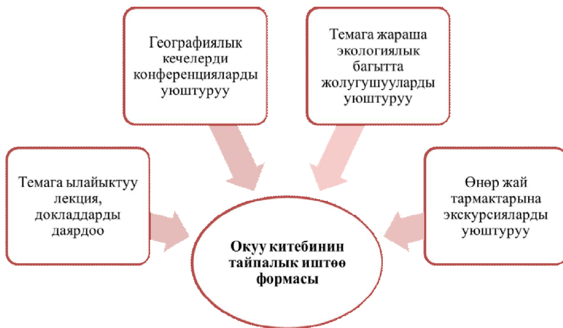
1-сүрөт. Географияны окутууда тайпалык иштөөнүн формалары

Анда программадан сырткары кошумча материалдар да кошулушу мүмкүн. Окуу куралдары мугалимдин көрсөтмөсү боюнча окуу китеби менен катар сунуш кылынат. Айрым предметтер боюнча маселелердин жана көнүгүүлөрдүн, диктанттардын жыйнагы түзүлөт. Окуу материалынын мазмуну жана аларды өздөштүрүүнүн жолдору кошо көрсөтүлгөн.