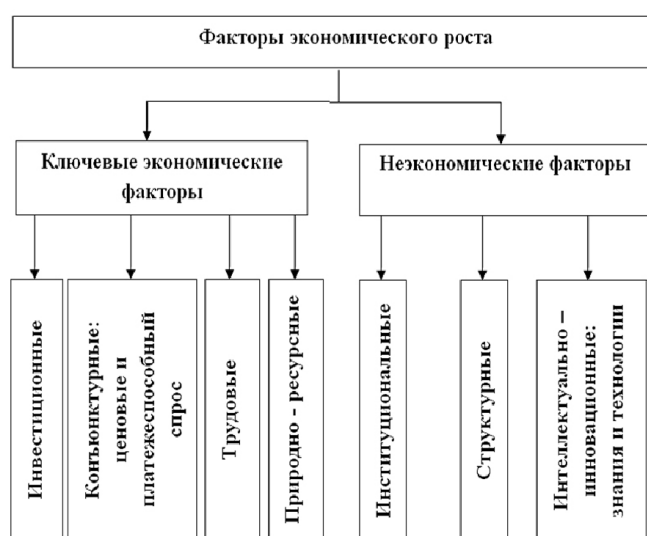
Рис. 1. Факторы экономического роста 1

Факторов роста множество, и они непостоянны, поскольку многообразны различные взгляды исследователей. В одном из источников, посвященных исследованию экономического роста, факторы представлены следующим образом: