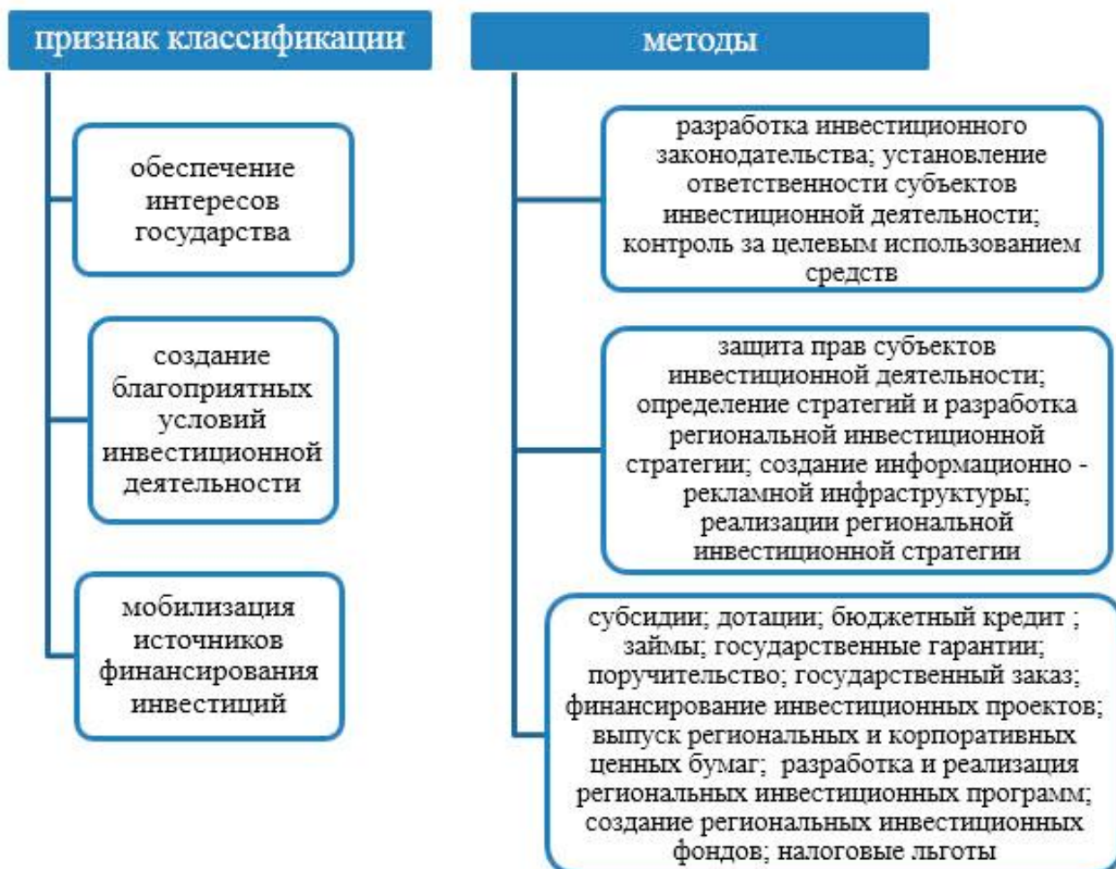
Рис. 2 - Методы регулирования инвестиционной деятельности на региональном уровне [6].

Эти инструменты и методы воздействия государства на инвестиционную политику выступают основными механизмами государственного регулирования инвестиционных процессами в Кыргызстане (рис. 2).