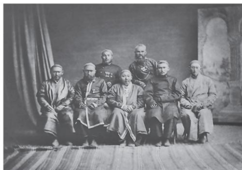
Бий жана казы сотторунун өкүлдөрү

стандын түндүгүндө манаптар да сот болуп эсептелген.” 2