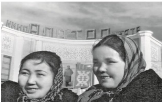
Кыргыз ССРинин Жогорку сотунун Төрайымы Ф. Кыдырбаева (оңдо) Ала-Тоо аянтында, Фрунзе шаары

Кыргыз ССРинин Жогорку Сотунун курамы төрагадан, анын орун басарынан, сот мүчөлөрүнөн, ишти кароого чакырылган элдик арачылардан турган.