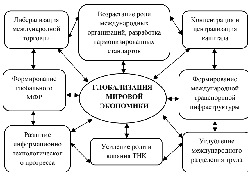
Рисунок 1 - Взаимосвязи факторов глобализации мировой экономики.

- обострение международной конкуренции, которая наряду с расширением рынка ведет к углублению специализации и международному разделению труда, стимулирующих в свою очередь рост производства не только на национальном, но и на мировом уровне;