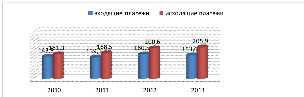
График 1. Количество входящих и исходящих платежей по телекоммуникационным системам SWIFT по годам (количество тыс. ед.)

Общий объем исходящих платежей по телекоммуникационным системам SWIFT в 2010 году составило 951069,80 млн. сомов, 2011 году этот показатель составил 831605,00 млн. сомов, 2012 году 775039,20 млн. сомов, 2013 году 774883,70 млн. сомов.