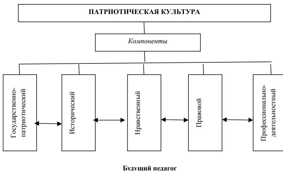
Рис. 1. Структура патриотической культуры будущего педагога.

На наш взгляд, активное воздействие на формирование патриотического сознания личности так же имеет социальная среда как совокупность социальных условий и отношений, которые окружают субъект патриотического сознания. Личность со сформированным патриотическим сознанием характеризуется, по мнению М. Роевой, гражданско-патриотической позицией, которую автор определяет как идейно-нравственную позицию личности, выраженную в ответственности по отношению к деятельности [2]. Следует отметить, что мы придерживаемся понимания патриотических знаний М. Роевой, которая понимает базу знаний, направленных на формирование патриотических убеждений, за счет которых, в свою очередь, патриотическое сознание личности получает более полное развитие, обогащается его структура, совершенствуются формы и средства распространения патриотических идей в массы.