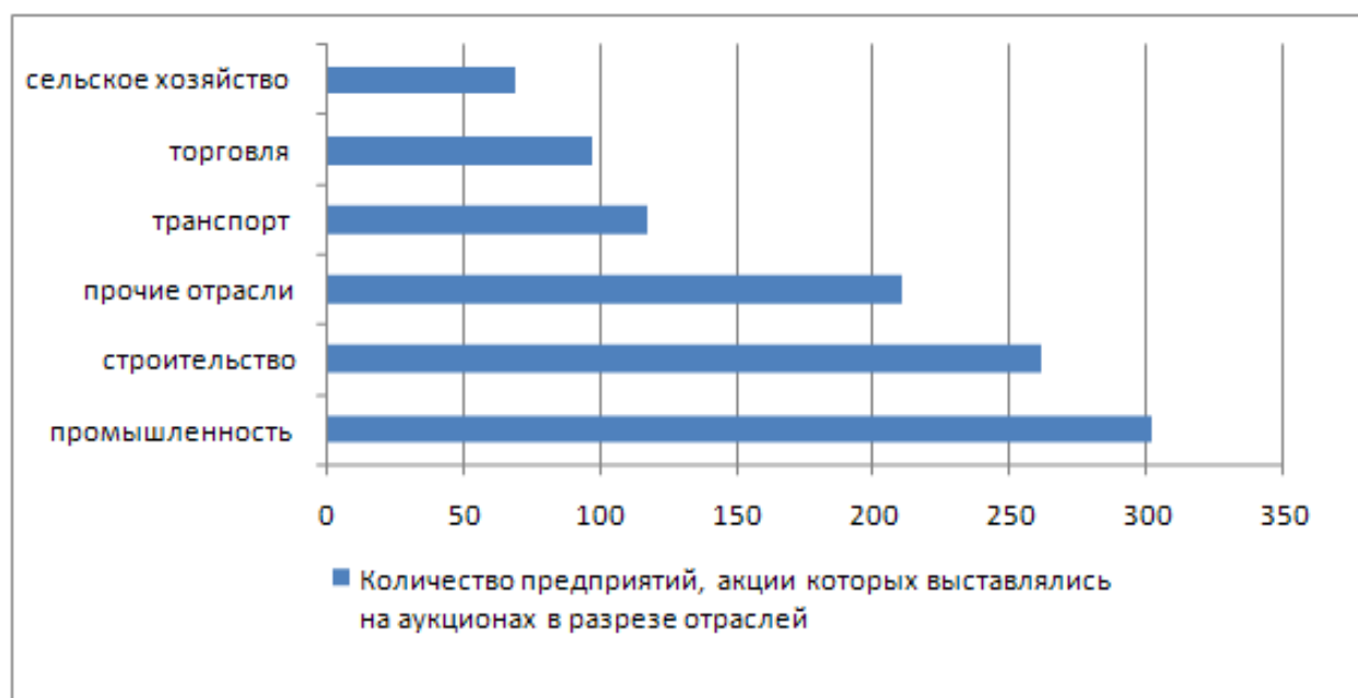
Рис. 2. Количество предприятий, акции которых выставялись на аукционах в разрезе отраслей

На рис. 2 показано, что наибольшее количество предприятий, выставяемых на аукционах, принадлежало таким отраслям, как промышленность, строительство, а наименьшее составили предприятия сельского хозяйства и торговли.