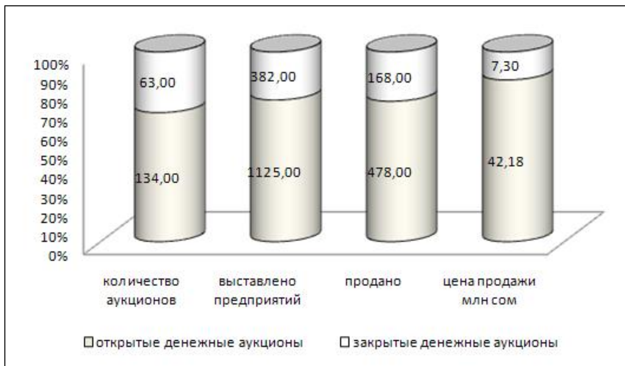
Рис. 1. Денежные аукционы

На рис. 2 показано, что наибольшее количество предприятий, выставяемых на аукционах, принадлежало таким отраслям, как промышленность, строительство, а наименьшее составили предприятия сельского хозяйства и торговли.