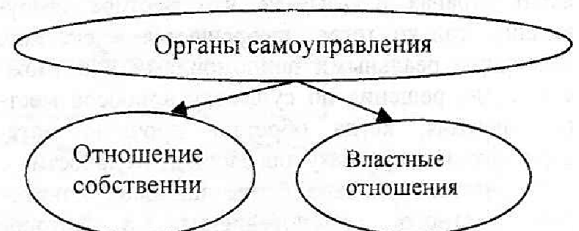
Рис.1.1. Соотношение полномочий органов местного самоуправления в сфере регулирования хозяйственных отношений.

Естественно, что права органов местного самоуправления в отношении этих групп и методы управления ими будут различными. Так, права органов местного самоуправления в отношении муниципальных предприятий не должны отличаться от прав любого собственника в отношении принадлежащего ему предприятия, права же на регулирование хозяйственной деятельности других собственников должны быть строго регламентированы законодательством, поскольку здесь речь идет о применении властных полномочий, а сами органы местного самоуправления выступают не как хозяйствующий субъект, а как власть.