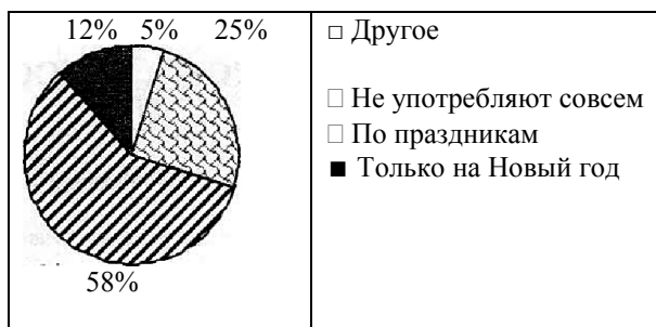
Диаграмма 1 Наличие вредных привычек (употребление алкоголя) среди учеников

Установлен высокий уровень употребления алкогольных напитков среди школьников. Так, 58% школьников признали факт употребления алкоголя по праздникам, 12% употребляли его на Новый Год и лишь 25% школьников ответили, что не употребляют алкоголь вообще (диагр. 1).