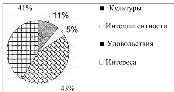
Диаграмма 4 Ответы учащихся об употреблении табака

Изучение мнения учащихся о вредности курения дает следующую картину: 73% учащихся ответили утвердительно, что курение наносит вред, 19% детей ответили, что не знают, вредно ли курение (диагр.3).